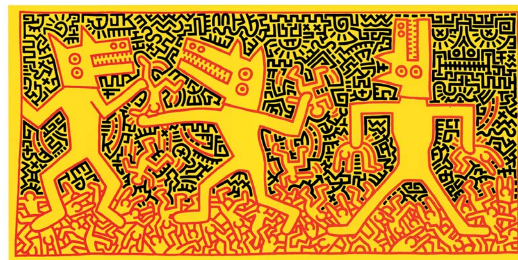
Keith Haring, Senza titolo , 1983, Acrilico su tela, cm 290x590, Palazzo Reale di Caserta