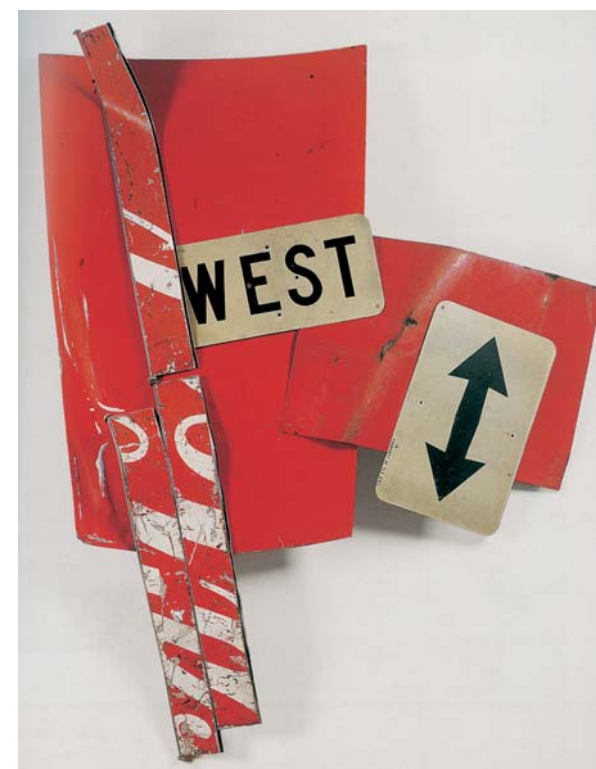
Robert Rauschenberg, West Go Ho (Glut) , 1986 Metallo assemblato, 212 x 165 x 27 cm Palazzo Reale di Caserta, Collezione Terrae Motus