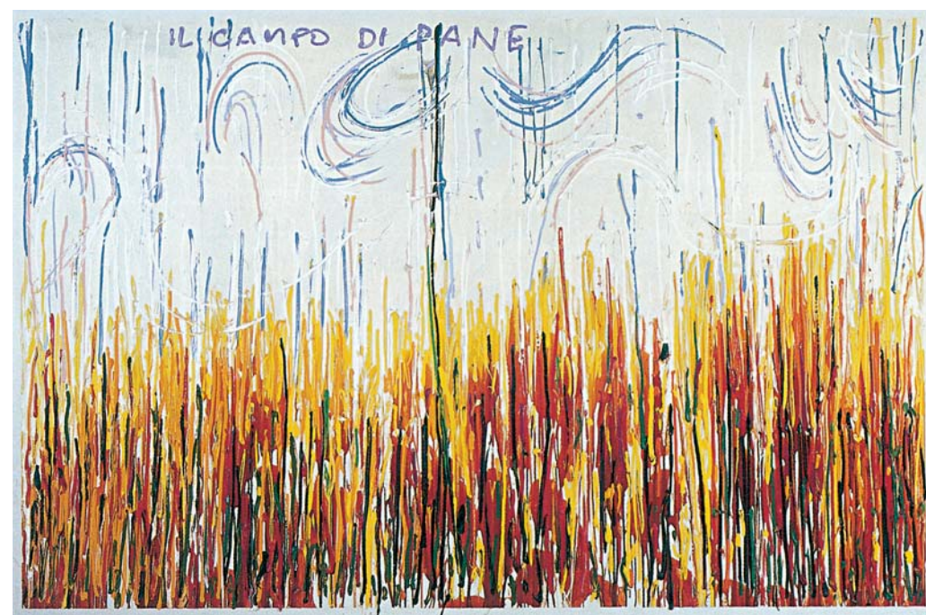
Mario Schifano, Il campo di pane , 1984 - smalto e acrilico su tela, 216 x 316 cm Collezione del Museo d'Arte Contemporanea, Gibellina