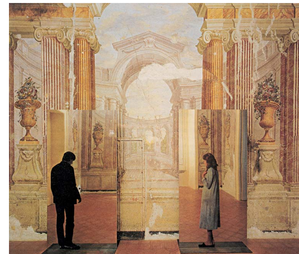
Michelangelo Pistoletto, Annunciazione Terrae Motus , 1962-1984 serigrafia su acciaio inox lucidato a specchio, dittico 250x125 cm ogni pannello Palazzo Reale di Caserta, Collezione Terrae Motus

DPC, per garantire la DIFESA più efficace, questa volta intesa come capacità di pronto intervento in emergenza, e per favorire il miglioramento delle conoscenze, attraverso lo studio dettagliato del fenomeno;