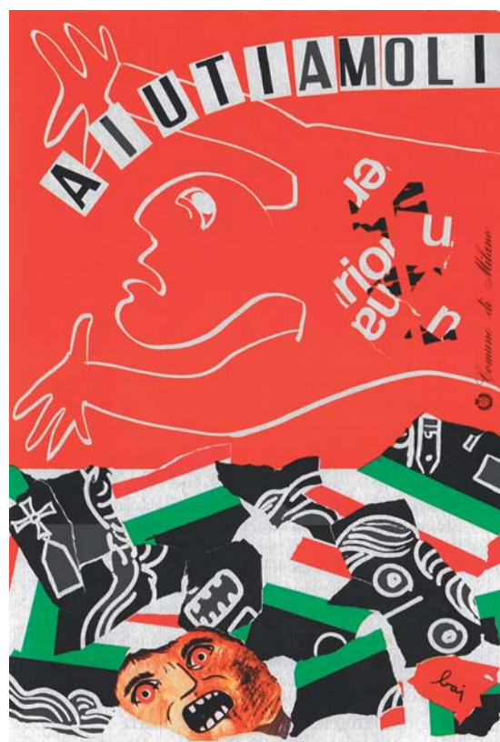
Enrico Baj, Aiutiamoli , 1980 Manifesto, 102 x 72 cm - Collezione privata

L'esposizione, itinerante, ripercorre i territori colpiti nell'ultimo secolo da alcuni dei principali eventi della storia sismica italiana, ospitando prestigiose opere provenienti da tutta Italia, grazie alla collaborazione di musei, archivi, biblioteche, gallerie pubbliche e private.